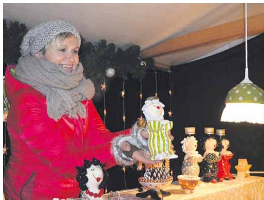
Wäre das nicht ein ideales Weihnachtsgeschenk?

Fotogalerie Weitere Bilder vom Christkindlimärt finden Sie im Internet unter: www.willisauerbote.ch www.wiggertalerbote.ch