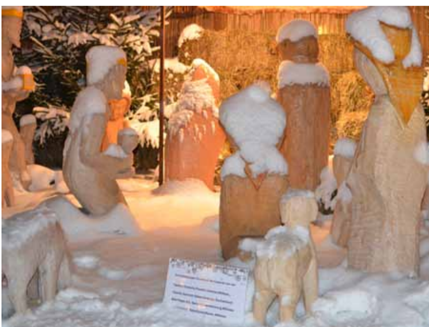
Die Weihnachtsskrippe mit lebensgrossen Figuren zeigte sich im Winterkleid.

Fotogalerie Weitere Bilder vom Christkindlimärt finden Sie im Internet unter: www.willisauerbote.ch www.wiggertalerbote.ch