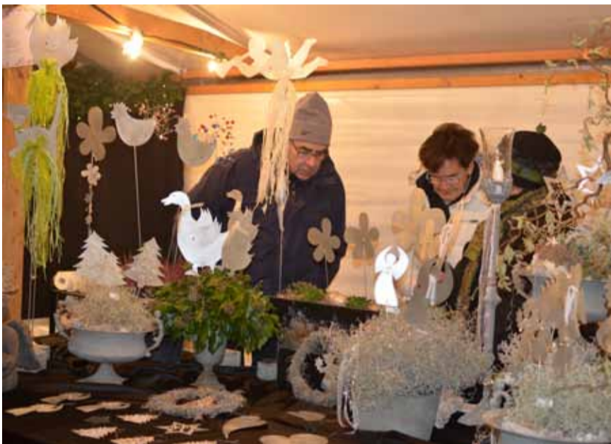
Die Freunde des Handwerkes kamen an vielen Ständen auf ihre Kosten.

Willisau | Impressionen vom 16. Christkindlimärt