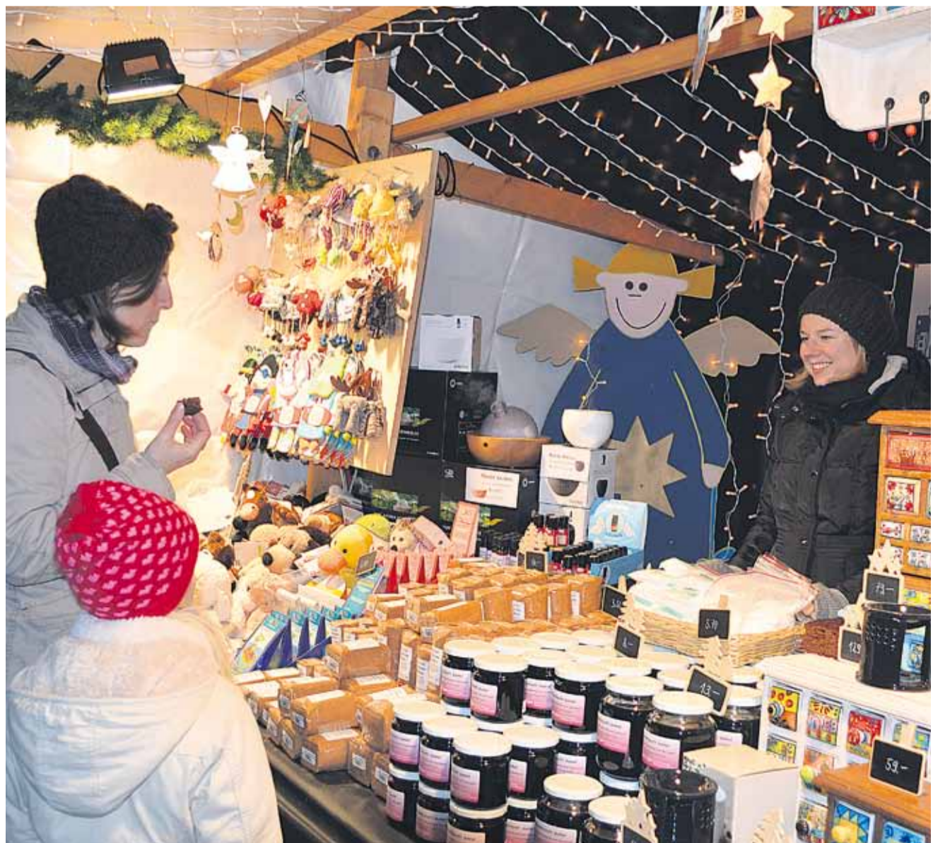
Trotz der Kälte verging den Standbetreibern das Strahlen nicht.