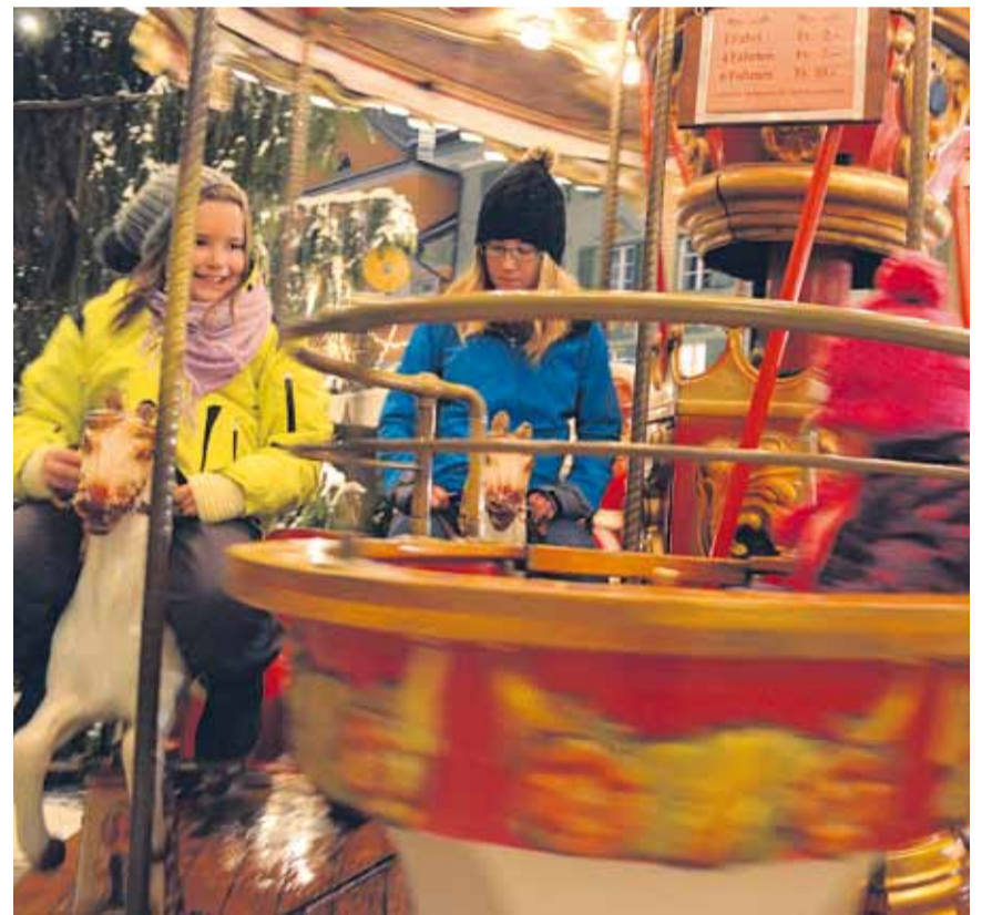
Beliebt bei den jungen Gästen: das Spielkarussell vor dem Rathaus.