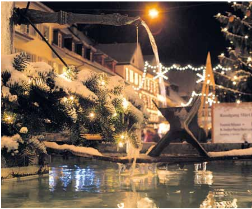
Winterzauber und Weihnachtsstimmung – die perfekte Kombination.